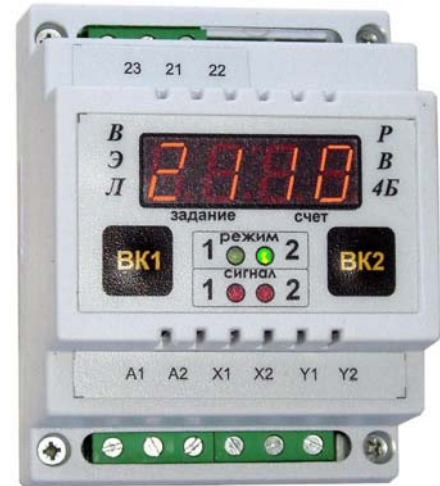
Рис.1 Внешний вид