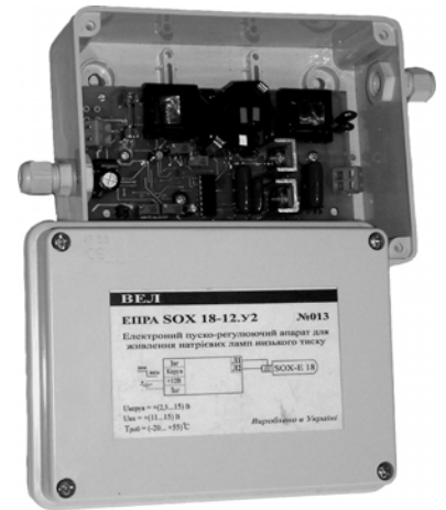
Рис.1 Внешний вид ЭПРА SOX 18-12 исполнение У

НПП «ВЭЛ», Киев, Тел. (044) 200-93-54; Факс (044) 434-83-44; E-mail: wel@naverex.kiev.ua Internet: www.wel.net.ua