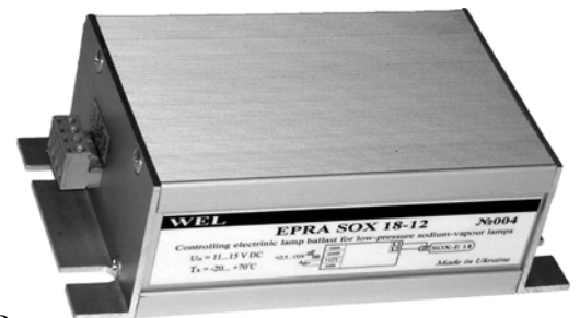
Рис.2 Внешний вид ЭПРА SOX 18-12 исполнение ТС