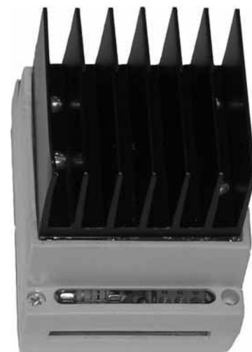
Рис.1 Внешний вид БЖ100