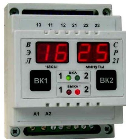
Рис 1. Внешний вид реле