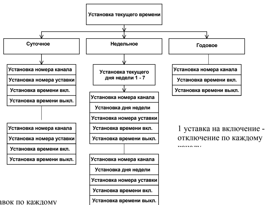
Схема программирования реле.